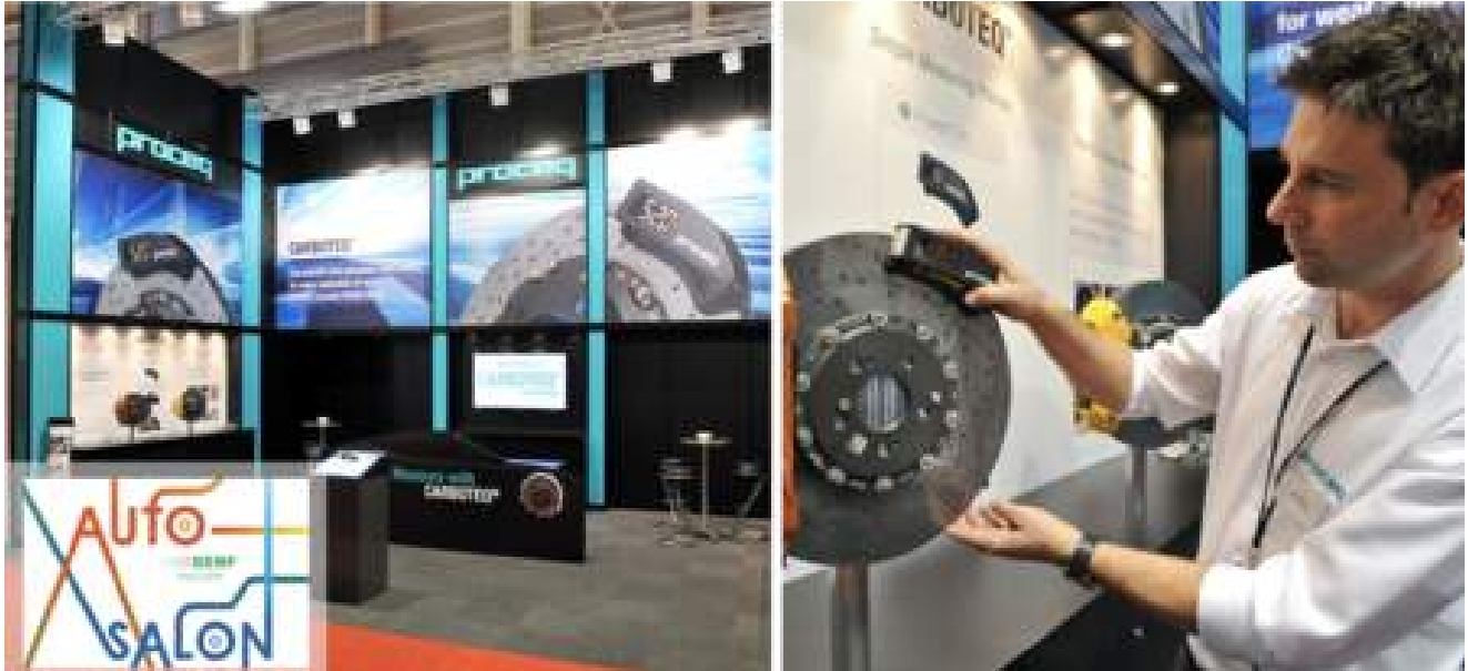
Carboteq carbon ceramic brake disc wear tester

2014 - Proceq führte den Rock Schmidt Rückprallhammer speziell für Gesteinstests ein. Mit der Einführung von Carboteq, dem weltweit einzigen Handgerät zur Messung des Verschleißes von Carbon-Keramik-Bremsscheiben, lieferte das Unternehmen eine weitere Lösung für ein wachsendes Problem.