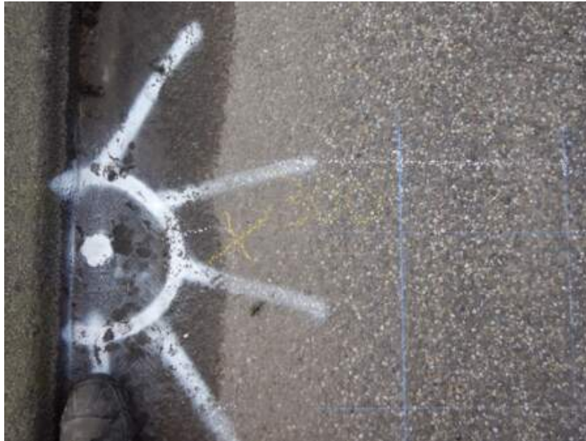
The indicated position for the light poles

Sin embargo, las nuevas ubicaciones indicadas para los postes de luz eran difíciles de alcanzar e inspeccionar, estaban demasiado cerca o se encontraban en la acera elevada.