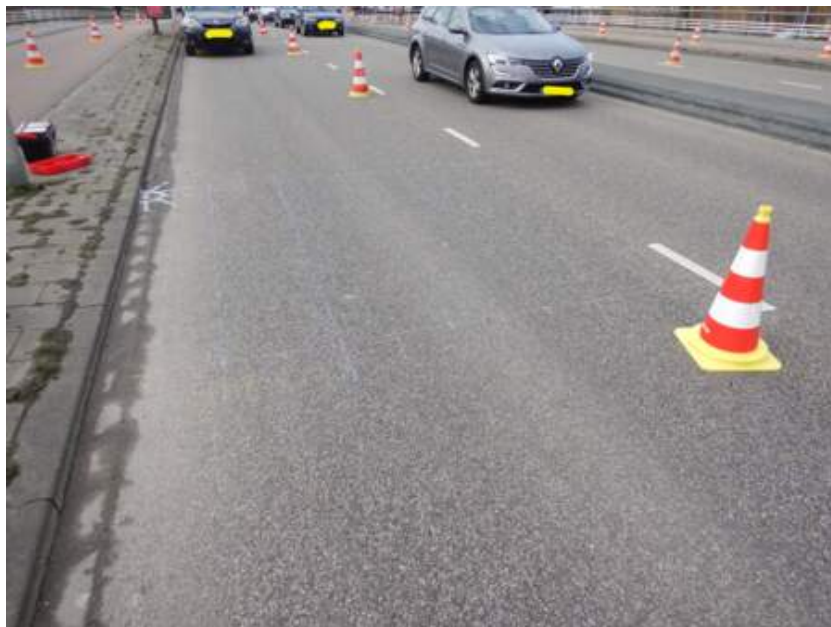
Traffic is a concern when working on bridges

La parte crucial de una investigación sobre un puente es el tiempo limitado que se tiene para trabajar en el lugar. Limitar el tráfico o cerrar el puente suele costar dinero al administrador del puente, por lo que el GPR es un método conveniente, ya que recoge datos rápidamente, sin causar ningún daño al puente.