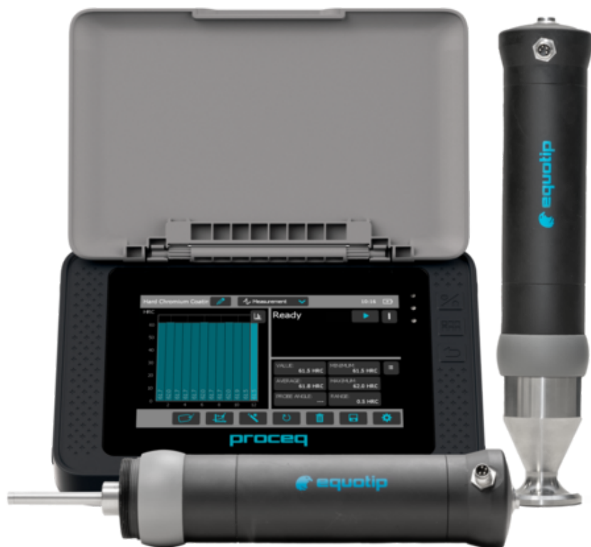
Equotip 550 UCI Motorized probes