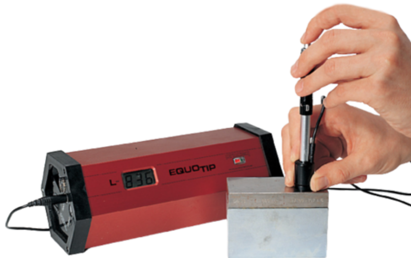
The original EQUOTip