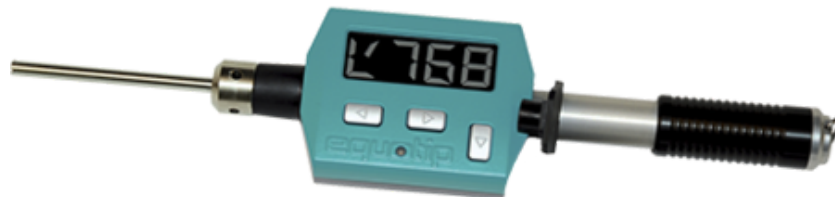
Piccolo 2 & Bambino 2