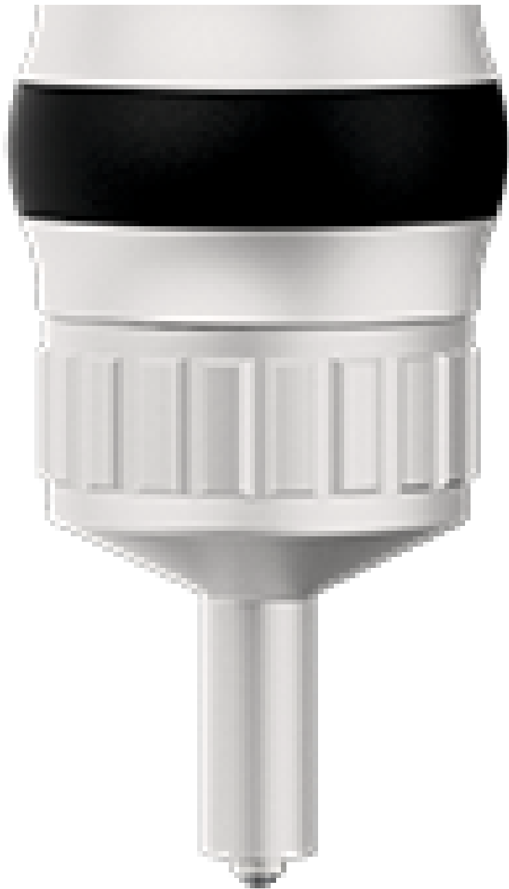
Equotip UCI 3-in-1