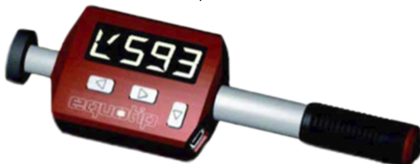
Piccolo & Bambino