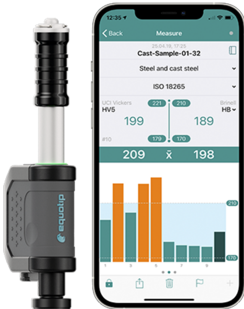
Leeb D Live