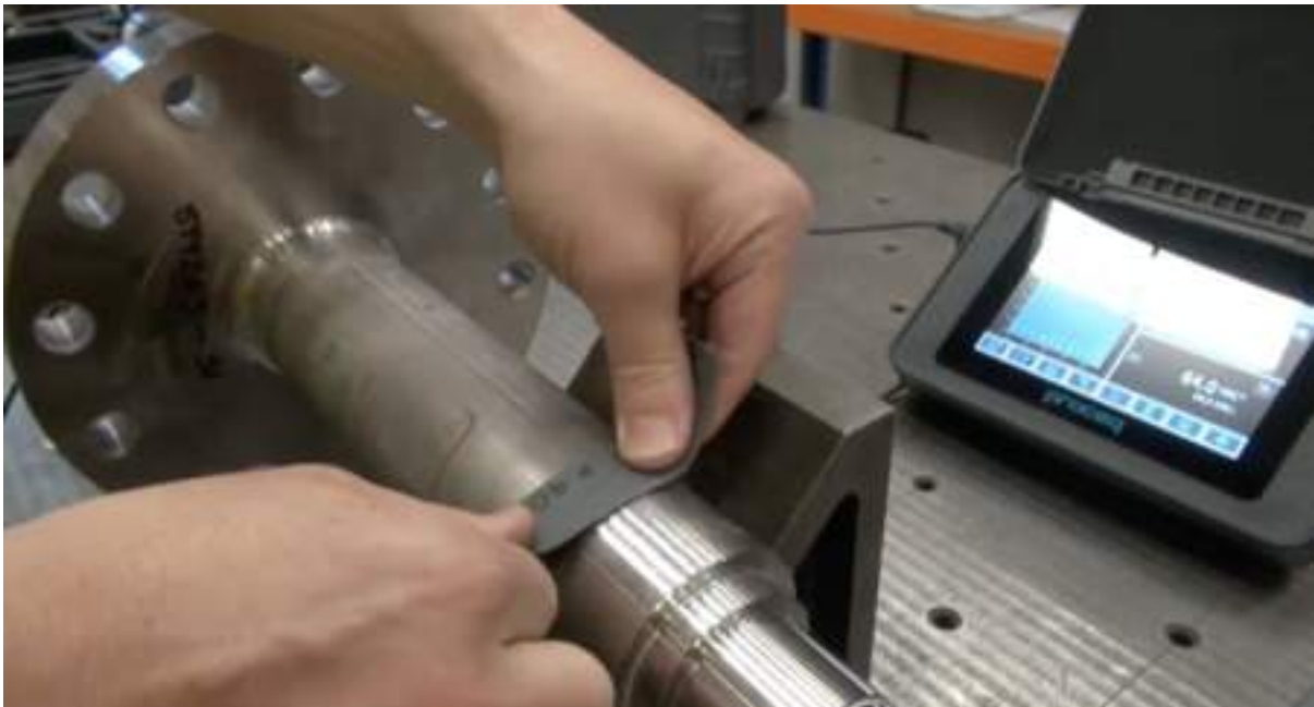
Fig. 5 — preparing the surface with sandpaper