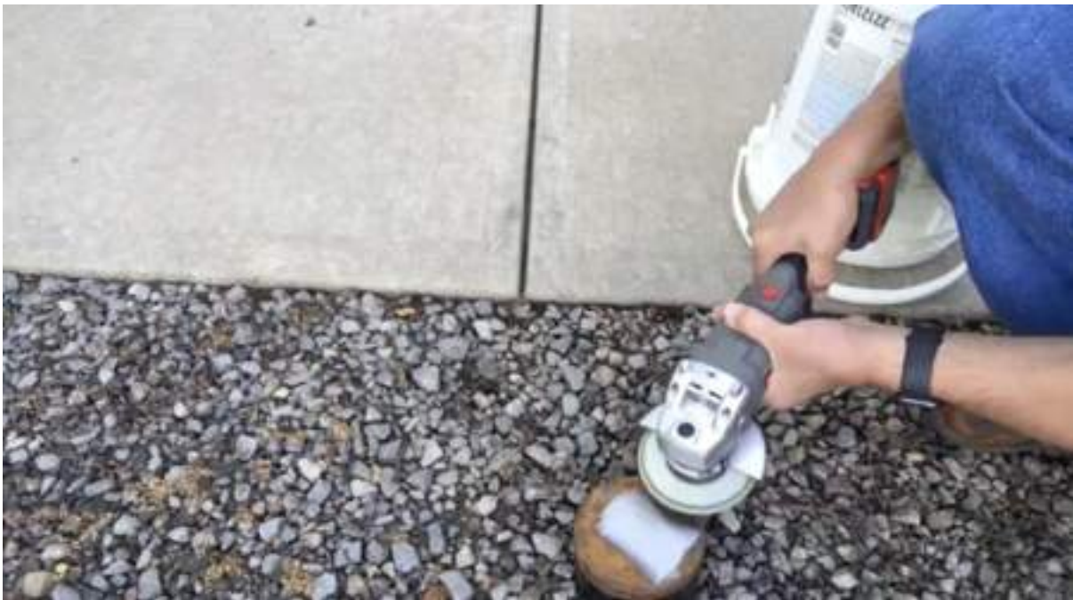
Fig. 4 — Tom Ott demonstrating the crosshatch technique