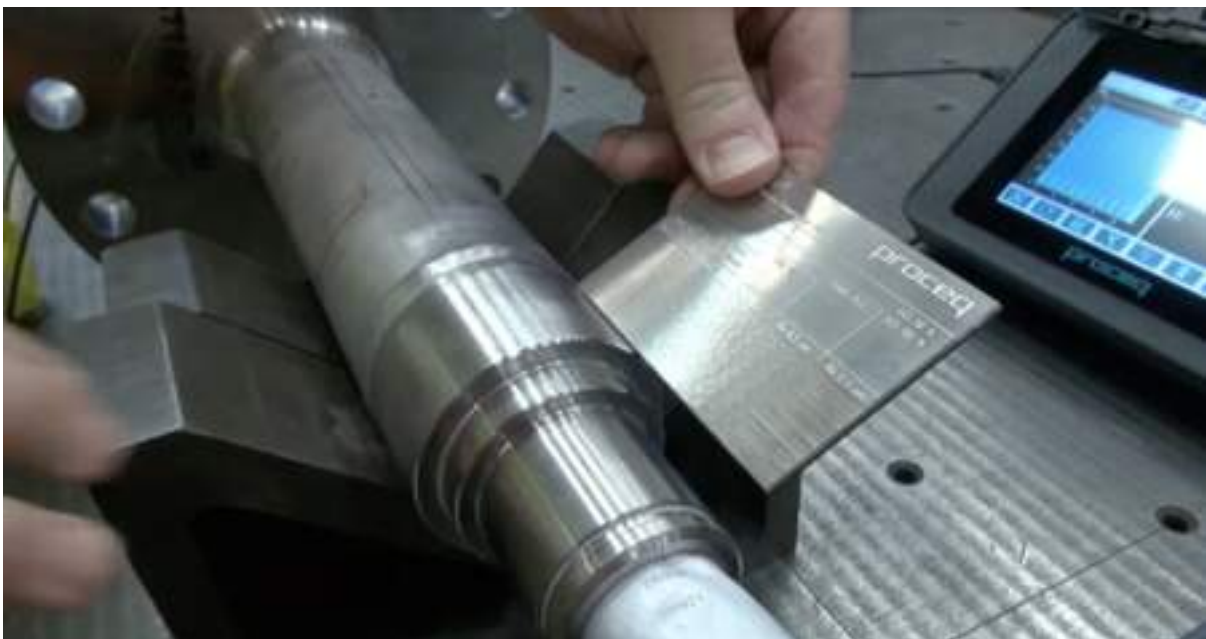
Fig. 6 — Checking the surface roughness comparator plate again

Per verificare la finitura senza un ingombrante misuratore di profilo, utilizzare nuovamente la piastra di comparazione della rugosità superficiale. Passare il dito sull'area preparata e confrontare la sensazione tattile con la piastra. Se la superficie risulta più liscia del requisito minimo indicato sulla piastra, si è pronti per il test.