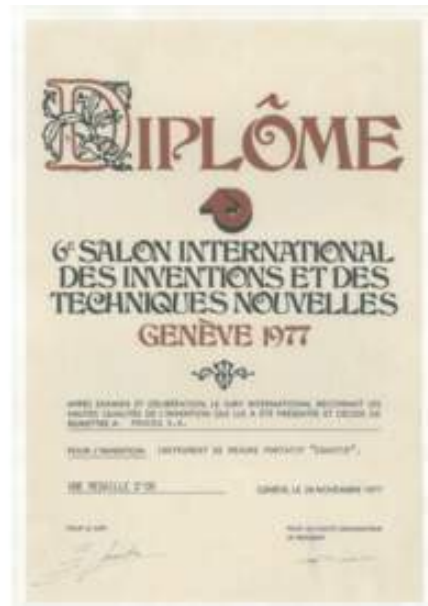
Equotip receives its first official recognition in 1977

Década de 80 - Foi uma década importante para a deteção de armaduras e avaliação do recobrimento do betão, uma vez que a Proceq lançou no mercado, com grande sucesso, o primeiro Profometer e medidores de recobrimento .