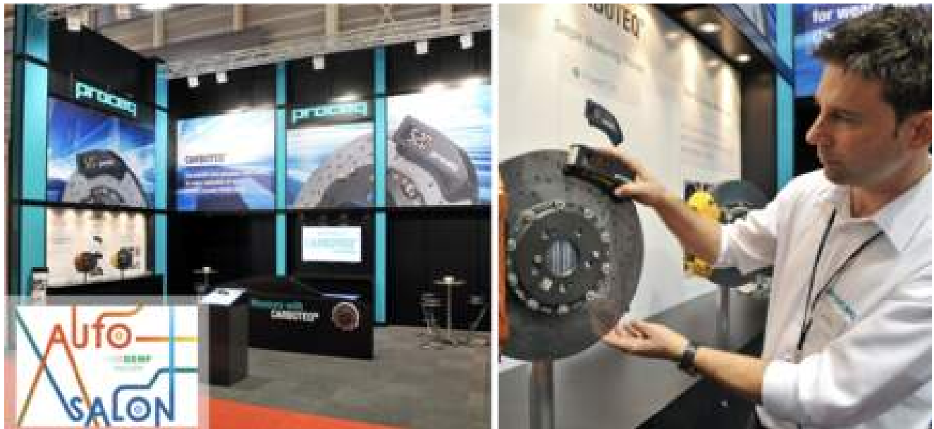
Carbotech carbon ceramic brake disc wear tester

2016 - A Proceq lançou a primeira solução de teste de dureza portátil completa da Internet das Coisas (IoT) do mundo, o Equotip Live. Esta foi a maior inovação em testes de dureza desde o lançamento inicial do Equotip.